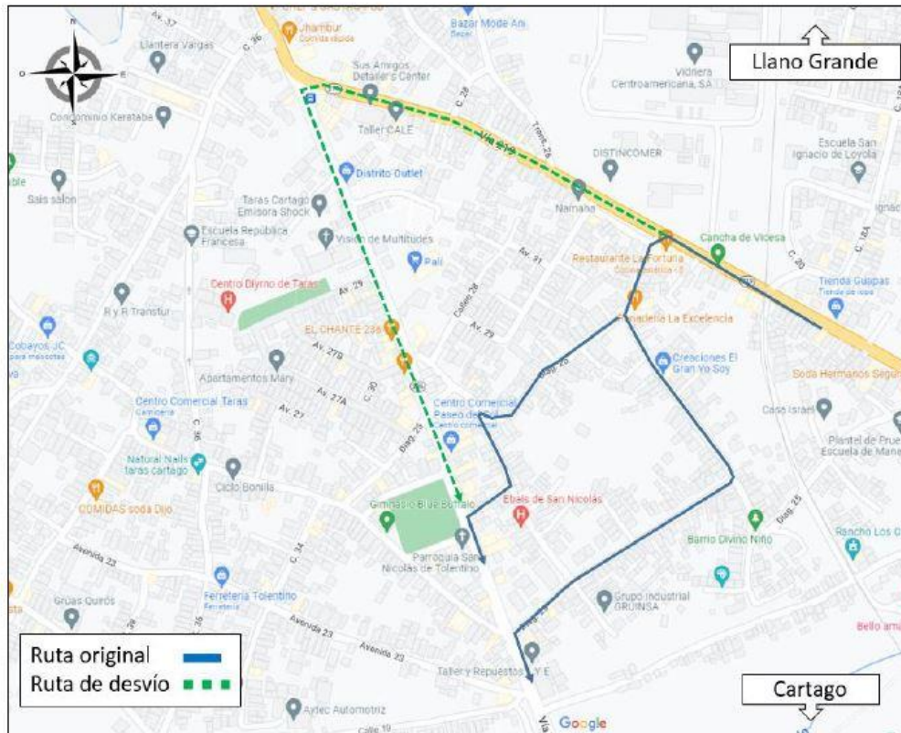
Figura 1. Modificaciones temporales, Ruta N°322

En atención a lo solicitado por la Dirección General de Policía de Tránsito (DGPT) y el Viceministerio de Transportes, se propone cambiar temporalmente el recorrido en sentido hacia Cartago para la Ruta N°322 , como se muestra en la siguiente figura: